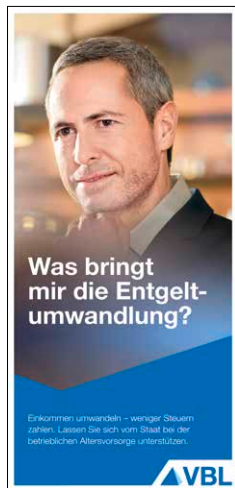
Entgeltumwandlung Stand Januar 2017