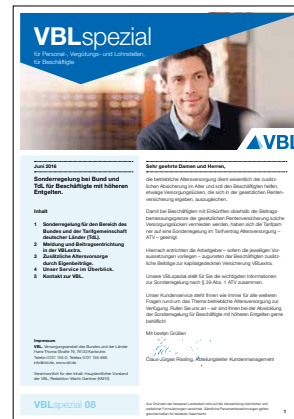
08 Beschäftigte mit höheren Entgelten Stand Juni 2016