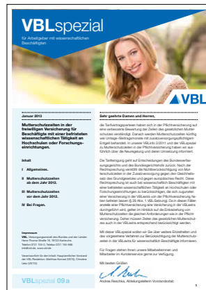
09a Mutterschutzzeiten Wissenschaftler Stand Januar 2013