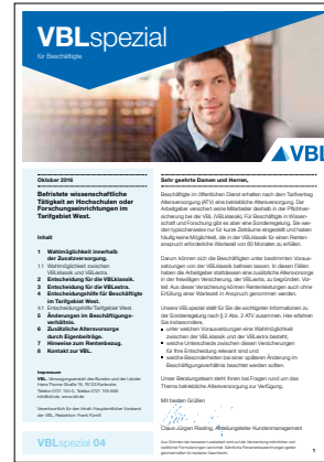
04 Wissenschaftlich Beschäftigte West* Stand Juni 2016