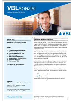
03 Hinweise zur Betriebsrente Stand Januar 2017