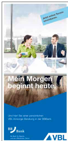
VBL vor Ort Stand Dezember 2015