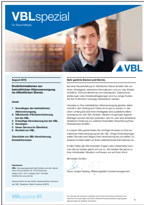
01 Erstinformationen zur Altersversorgung Stand August 2016