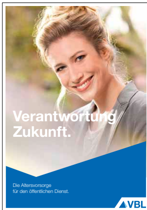
Unternehmensbroschüre* Stand Januar 2017