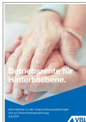
Betriebsrente für Hinterbliebene Stand Juli 2016