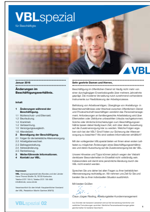
02 Änderungen im Beschäftigungsverhältnis Stand Januar 2017