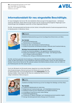
Merkblatt Erstversicherte* Stand Februar 2016