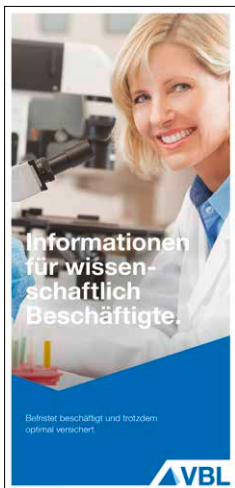
Wissenschaftlich Beschäftigte Stand Januar 2016