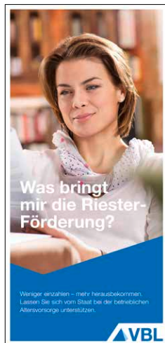
Riester-Förderung Stand Januar 2017