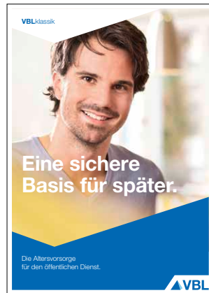
Produktbroschüre VBLklassik Stand Januar 2017