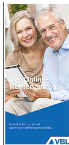
Online-Rentenanspruch Stand März 2015