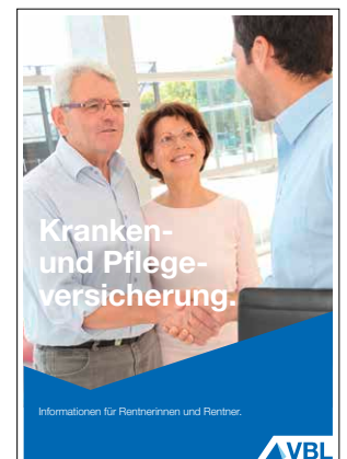
Kranken- und Pflegeversicherung Stand November 2016