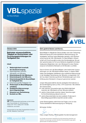
05 Wissenschaftlich Beschäftigte Ost* Stand Juni 2016