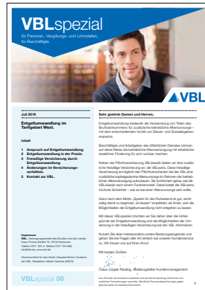
06 Entgeltumwandlung West Stand Januar 2017