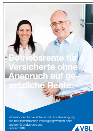
Nichtsozialrentner Stand Januar 2016