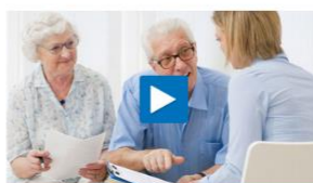
VBLklassik – Betriebsrente für Hinterbliebene