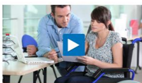
VBLklassik – Betriebsrente wegen Erwerbsminderung